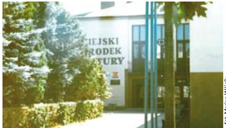
fol. Marian Wójcik

W roku 2004 przeprowadzony został konkurs na nową nazwę kina. Zwycięską propozycją okazała się „Cooltura”,