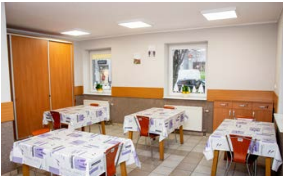
Remont w obu miejskich świetlicach poprawił warunki pobytu ich podopiecznych