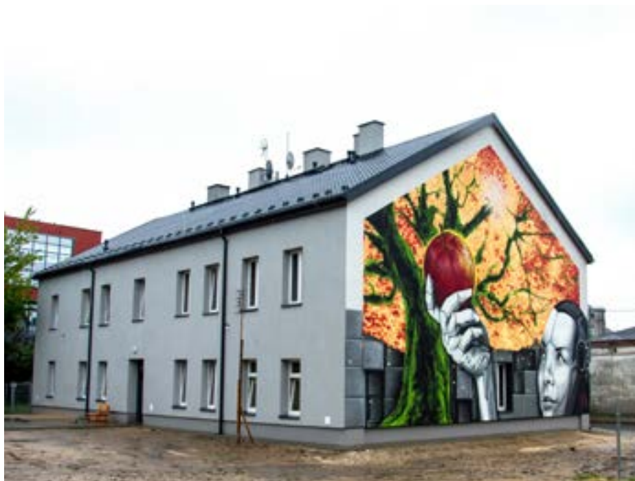
Modernizacja dziesięciu miejskich kamienic to jeden z etapów rewitalizacji śródmieścia

nej kosztować będzie blisko 3,5 mln zł., natomiast koszt całej rewitalizacji śródmieścia to ok. 14 mln zł, z czego ponad 9 mln zł to środki unijne. Do inwestycji dołożyła