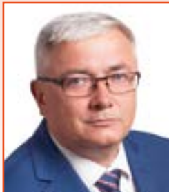
Piotr Wysocki Przewodniczący Rady Miejskiej