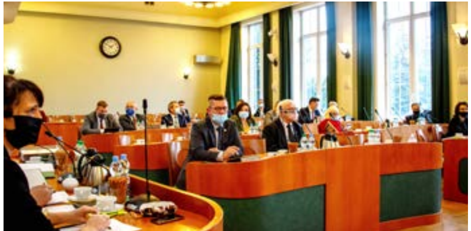
Prezydencki projekt uchwały radni przyjęli niemal jednogłośnie

Wspomnianego projektu uchwały początkowo nie było w planowanym porządku styczniowych obrad Rady Miejskiej. Punkt ten nie mógł być ujęty wcześniej, ponieważ ustawa dająca samorządom możliwość wprowadzenia takiej pomocy przedsiębiorcom weszła w życie dwa dni przed sesją. Zgodnie z przyjętym przez radnych dokumentem, przedsiębiorcom,